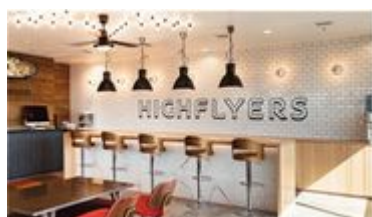
ハイフライヤーズ本社