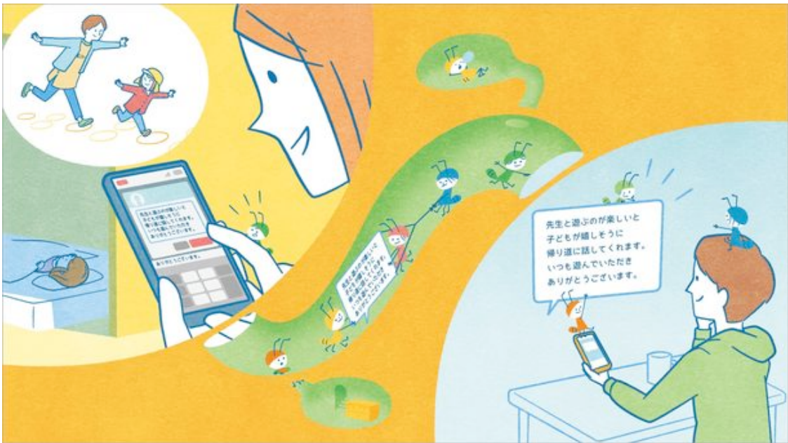
先生に感謝を伝える保護者

「ありがとう」を伝えることに特化し、保護者自身のタイミングでダイレクトに先生に「ありがとう」のメッセージを届けることができる機能は、コミュニケーションを更に広げる機会にもなります。