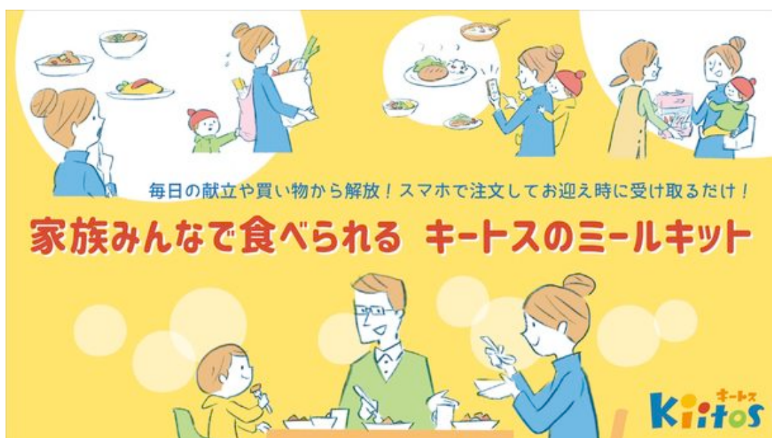
ミールキットで家族団欒の時間が増える様子

ハイフライヤーズでは、子どもはもちろん、保護者、先生、保育園に関わるすべての人に「また明日も来たい」と「選ばれる保育園」を目指し、業界では珍しい様々な取り組みを実施しています。