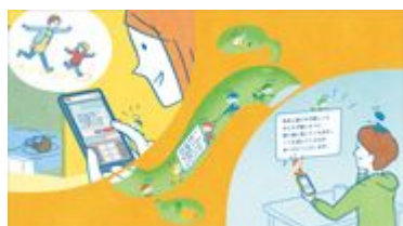
先生に感謝を伝える保護者