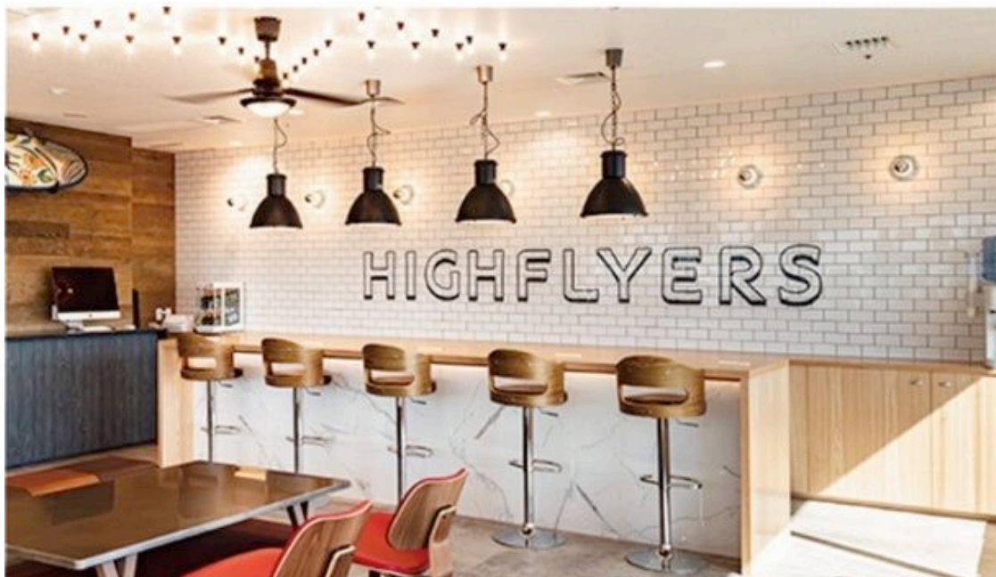
ハイフライヤーズ本社

千葉県内にて認可保育園「キートスチャイルドケア」・「キートスベビーケア」を運営しています。保育園が持つ固定観念を払拭し、保育業務のDXを推進する事で社員が自発的にイノベーションを生み出せる組織を目指しています。