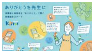
「ありがとうございます先生に」