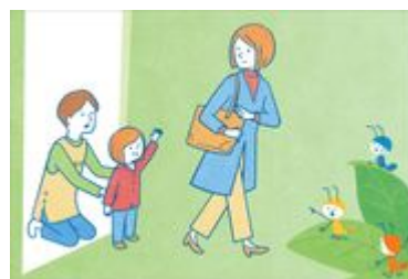
仕事へ向かう保護者