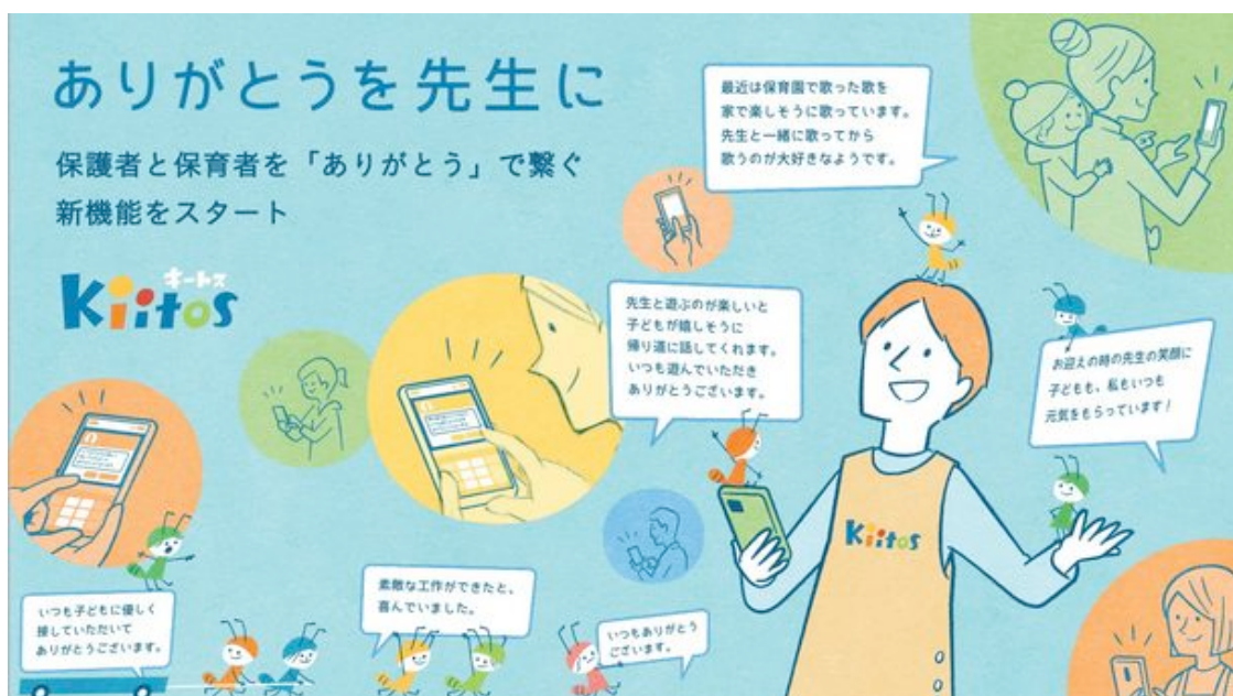
「ありがとうを先生に」

また、新機能のコンセプトムービーを、TikTokで総再生回数8億回を超える大人気の縦型ショートドラマクリエイター「ごっこ倶楽部」(参照：ごっこ倶楽部 @gokko5club )とタイアップして制作いたしました。このコンセプトムービーは公開から20日間で860万回再生を突破し、保育の仕事に携わる方や保育園に子どもを預けている保護者から大きな反響を得ています。