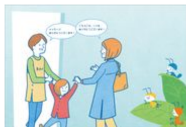
会話する保護者と先生