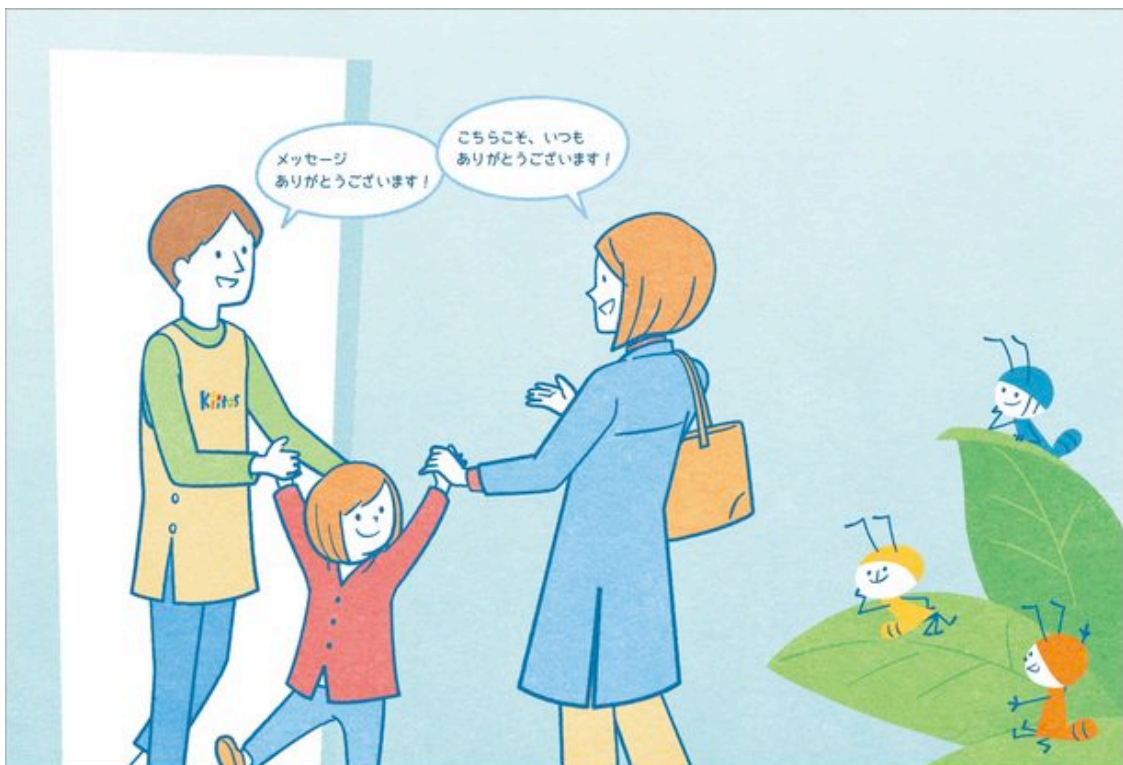
会話する保護者と先生

※この機能は保護者と先生がお互いの連絡先を交換せずに、保護者から先生に「ありがとう」を送ることができます。