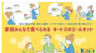
ミールキットで家族団欒の時間が増える様子